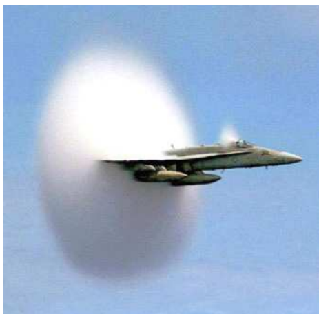
Abb 2.: Eine der häufigsten Arten von Schockwellen ist der Überschallschock, der von Düsenflugzeugen wie diesem Jet der US Navy bei einem sehr schnellen Flug übers Meer erzeugt wird. Wenn ein Überschallflugzeug die Schallmauer durchbricht, holt es seine eigenen Schallwellen ein. Diese werden zu einer kegelförmigen "Schockwelle" zusammengedrückt, die sich nach außen in Richtung Boden bewegt und dabei den bekannten Überschallknall erzeugt. Der Überschallschock ist für uns unsichtbar, aber bei hoher Luftfeuchtigkeit kommt es vor, dass Dampf zu Wassertropfen kondensiert und dabei eine sichtbare, kegelförmige Wolke am Heck des Düsenflugzeugs bildet.

Mit dem Spektrometer identifizierten die Wissenschaftler in Stephans Quintett eine ungewöhnlich "verschmierte" Linie - die breiteste, die für heißen Wasserstoff jemals gefunden wurde. Aus ihr ließ sich eine Geschwindigkeit von 870 Kilometern pro Sekunde ableiten - das Gas bewegt sich also 2600 Mal schneller als der Schall in Luft (330 Meter pro Sekunde). "Anscheinend entstehen Wasserstoffmoleküle entweder in der Schockwelle oder hinter ihr, ähnlich Wassertropfen, die sich hinter einem Flugzeug bilden, das die Schallmauer durchbricht. Nur passiert das hier in kosmischen Dimensionen und bei einer Geschwindigkeit von Mach 100 oder mehr", sagt Richard Tufts von der Astrophysik-Abteilung des Max-Planck-Instituts für Kernphysik in Heidelberg.